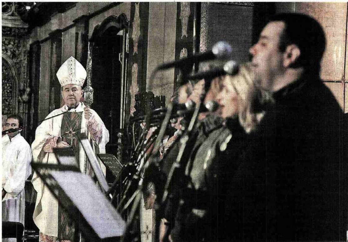
El arzobispo de Zaragoza, Manuel Ureña, durante la misa cantada por el grupo andaluz «Siempre Así»