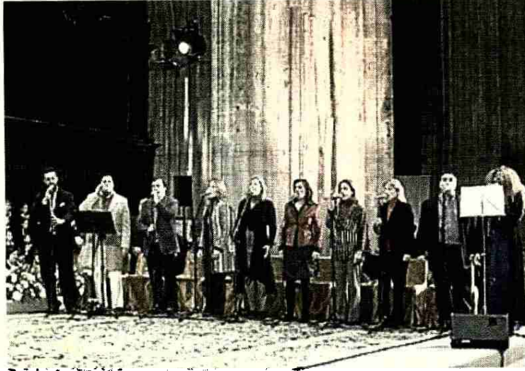
Siempre Así durante la Misa de la Alegría, en Sevilla. SIEMPRE ASI

ZARAGOZA. El sentimiento religioso y lo popular se unirán el domingo en la misa que se celebrará a las 12.30 en la catedral de La Seo de Zaragoza, y que contará con la participación de Siempre Así. El grupo andaluz trae a la capital aragonesa las canciones de su disco 'La Misa de la Alegría', en una celebración en la que también participarán los Infanticos del Pilar y un grupo de percusión de Senegal.