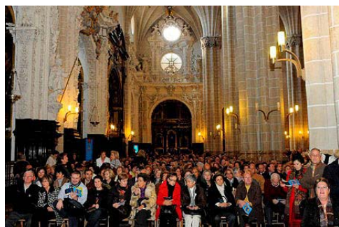
Uno de los laterales de la Seo El Salvador de Zaragoza el domingo 23 de noviembre

En la Seo de Zaragoza la acogida del público también fue espectacular. Casi 4.000 personas disfrutaron de esta Eucaristía tan especial y cientos de zaragozanos quedaron en la puerta lamentando no poder entrar porque el Ayuntamiento de Zaragoza decidió cerrar la Catedral El Salvador por motivos de seguridad.