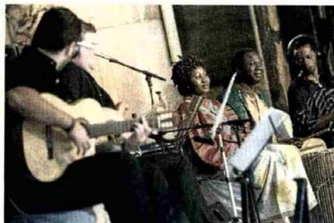
MÚSICAS DE OTRAS LATITUDES. Dos percusionistas de Mali y una bailarina senegalesa pusieron el toque exótico a la misa. P.E.