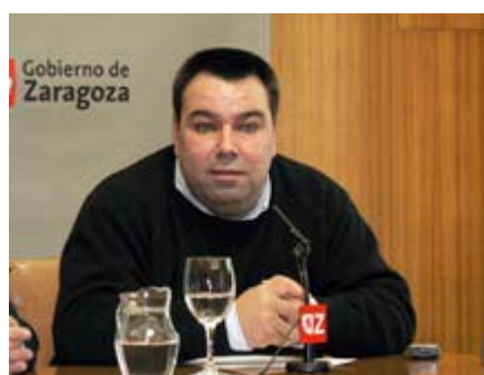
En el estreno en Sevilla acudieron 5.000 personas

Zaragoza.- El grupo sevillano Siempre Así traerá a Zaragoza la "Misa de la Alegría", que mezclará las diferentes culturas y religiones con la música el próximo domingo, 23 de noviembre, a las 12.30 horas en la Catedral de El Salvador. El arzobispo de Zaragoza, Manuel Ureña, oficiará la misa.