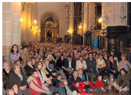
Uno de los laterales de la Seo de Zaragoza durante la Misa de la Alegría

El proyecto no pudo tener mejor acogida entre el público y la prensa, lo cual, añadido al deseo por parte del grupo Siempre Así de difundir su mensaje de humanidad y alegría por todos los rincones, hace de este estreno el inicio de una serie de réplicas que se repetirán durante los próximos años en otras catedrales de España.