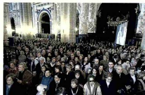
A REBOSAR. Miles de personas llenaron la Seo. Muchas se quedaron de pie, aunque muchas otras no pudieron ni siquiera entrar. P.F.