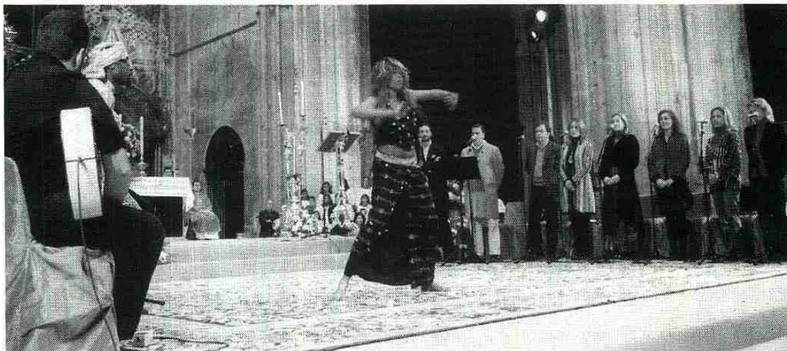
El grupo coral «Siempre Así» durante su actuación en la Catedral de Sevilla en febrero